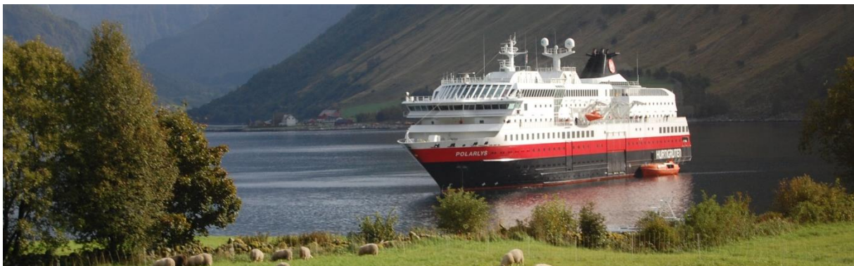
MS Polarlys