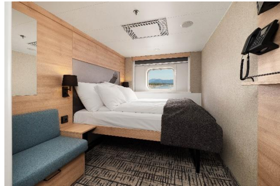
Beispiel Außenkabine Superior MS Polarlys