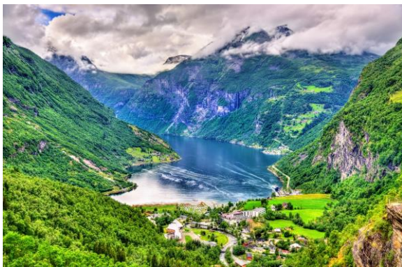
Blick zum Geirangerfjord